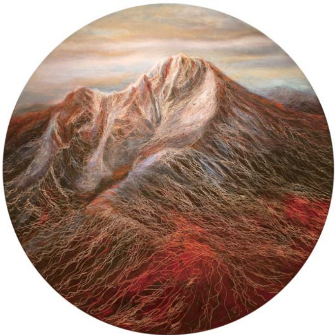
玉山 #5 Yu-Shang #5 oil on canvas 153 cm diameter 2012