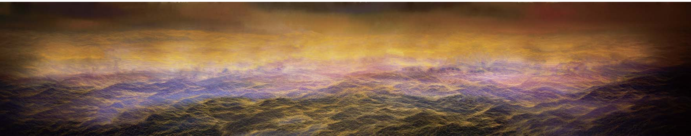
水 M Water M