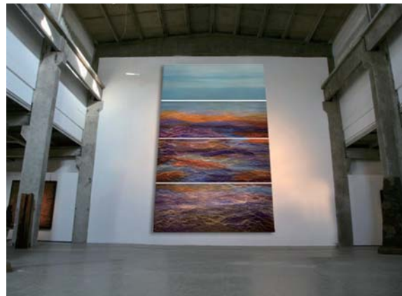
北京 鑄造美術館 Found Museum, Beijing