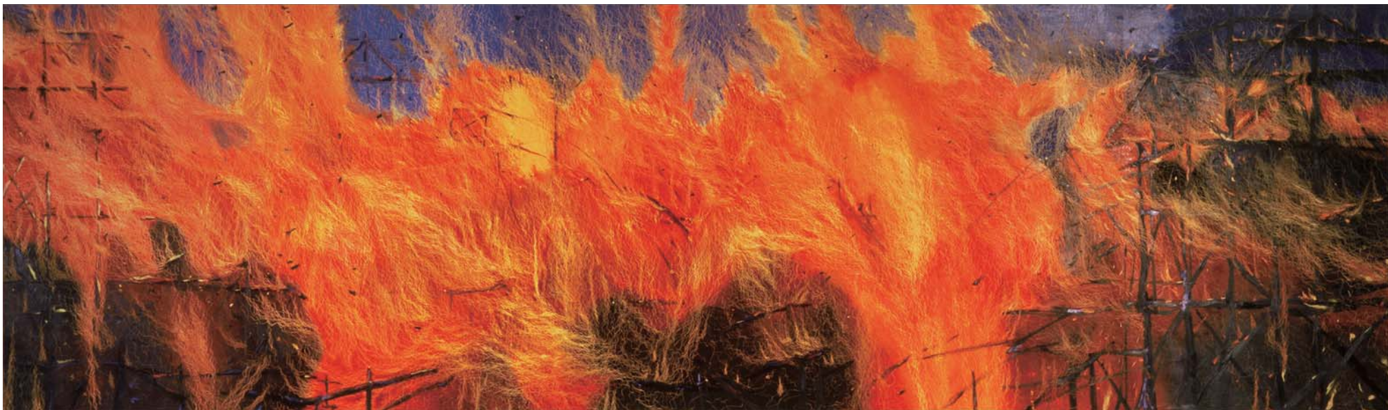
火 M Fire M